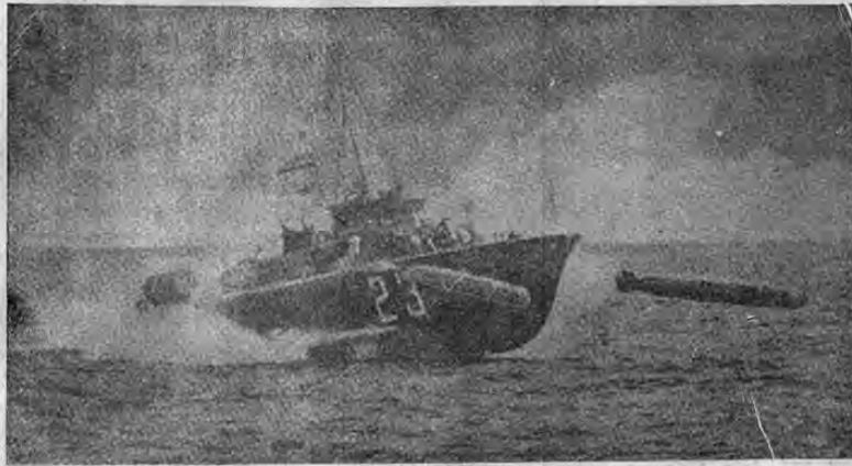
Una lancha torpedera británica, lanzando sus torpedos mientras avanza a enorme velocidad. Fue una lancha de estas la que luchó recientemente en el canal de la Mancha contra seis embarcaciones alemanas del mismo tipo, poniendo fuera de acción a una y obligándolas a retirarse.

Con el cambio operado en la recaudación de ese impuesto, que en adelante se hará por medio de cheques y no por el sistema de timbres, se logrará expedir más esa recaudación y se evita el engorroso papelero que el antiguo sistema obligaba