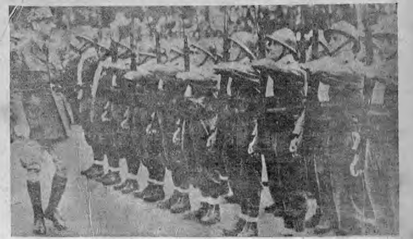
El general Charles de Gaulle, jefe de las fuerzas armadas de "la Francia libre", que lucharán al lado de la Gran Bretaña, pasando revista a sus tropas, cerca de Londres, el día 14 de Julio, Día de la Bastilla.

La rivalidad ruso-alemana que parece elevarse cada día más, vuelve a ser objeto de especulaciones en vista del nuevo y potente avance alemán en los Balcanes.