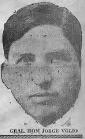
GRAL. DON JORGE VOLIO

Analicemos un tanto esa oración que nos es dedicada como un gran honor, para ver si aun subsiste la fuerza dialectica, o si ya no queda más que la habilidad superficial del esgrimidor de profesión; y que el público sensible que lee, coteja y recuerda, nos siga, porque el interés de este análisis no es propiamente para las gentes de hoy, sino para que no se engañen los que vendrán después con la historia